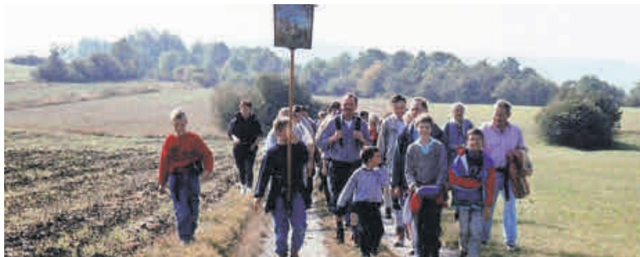
Die jüngsten Teilnehmer tragen am 18.9.1993 das neue Wallfahrtsbild voran.