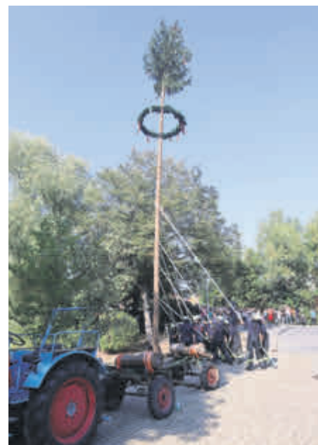
Gundelsheim, der Feuerwehr Gundelsheim (Baum aufstellen), dem Musikverein Gundelsheim (Festumzug), den zahlreichen Besucher*innen, ...

Ein großes DANKE an die Projektgruppe Stimmung, das Team Mittwochcafé Revival, der Bauhofmannschaft, den ehrenamtlichen Händen, den verständnisvollen Nachbarn rund um das Festgelände, dem SKK Bavaria