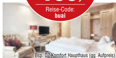
Bsp. DZ Komfort Haupthaus (gg. Aufpreis)